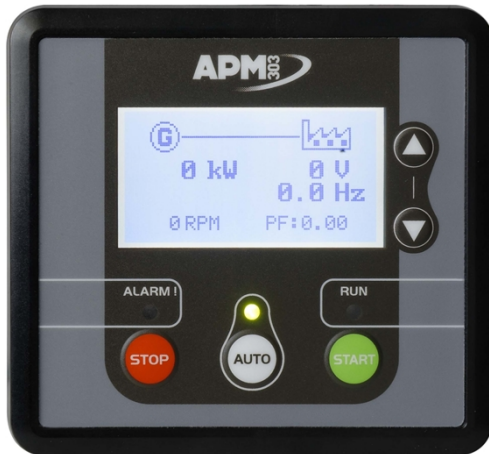
APM303, Einfache Bedienung

APM303 ist ein Multifunktionsgerät sowohl für den manuellen als auch den Automatikbetrieb. Mit einem LCD-Bildschirm und besonders benutzerfreundlicher Bedienung bietet dieses Gerät Grundfunktionen hoher Qualität für die einfache und zuverlässige Bedienung Ihres Stromerzeugers einschließlich der Möglichkeit, die Anlage zu überwachen. Es bietet folgende Funktionen: